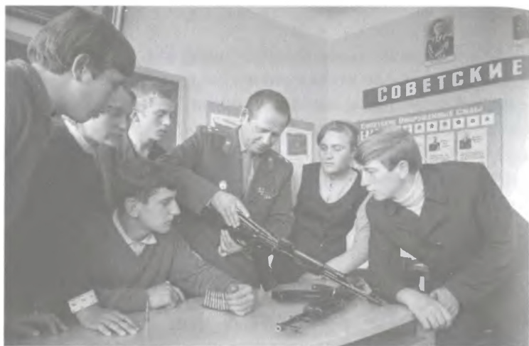
Ил. 9. Житомирская средняя школа № 20. Школьники на уроке начальной военной подготовки. 1971

тревогу за будущее (слухи о войне), что, в свою очередь, приводит в действие программу по обеспечению выживания в условиях голода (усиленные закупки продовольствия).