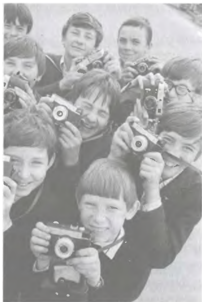
Ил. 8. Школьники на фотокружке

и фотографирует «на красную пленку» советских женщин, причем делает это специально, чтобы нанести стране репутационный ущерб. Пользователь «Живого журнала» с иронией вспоминает услышанную в детстве историю об одном таком иностранце: