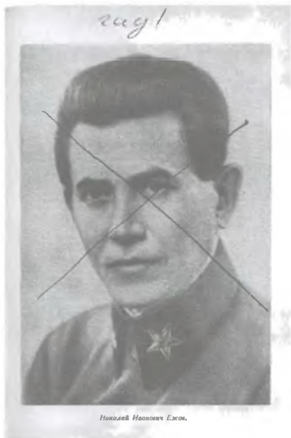
Ил. 1. Перечеркнутая фотография арестованного наркома Ежова с надписью «Гад!»

со школьников, должны были символически казнить — зачеркивая и уничтожая их портреты (ил. 1).