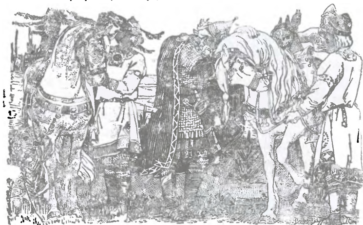
(Рисунок В. Васнецова)

100 ЛЕТ СО ДНЯ СМЕРТИ ВЕЛИКОГО ПОЭТА А. С. ПУШКИНА 10 февраля (29 января) 1837 г. — 10 февраля 1937 г.