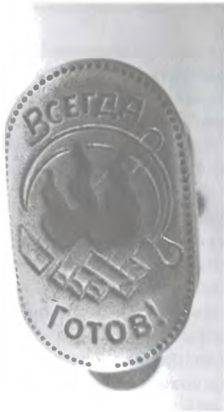
Ил. 4. Зажим для пионерского галстука с предполагаемой аббревиатурой ТЗШ: «троцкистско-» (перевернутый костер), «зиновьевская» (костер на боку), «шайка» (костер в обычном положении)

В 1930-е годы пионерский галстук не нужно было мучительно завязывать специальным узлом. Для этого у школьников были специальные металлические зажимы, на которых был изображен горящий костер с тремя языками пламени. В ноябре 1937 года школы Москвы и Ленинграда поразила эпидемия слухов об опасности этих зажимов. В гравировке с изображением пламени школьники и взрослые видели вездесущую «бородку Троцкого» 58 , его профиль 59 , а также подпись злодейской оппозиции: