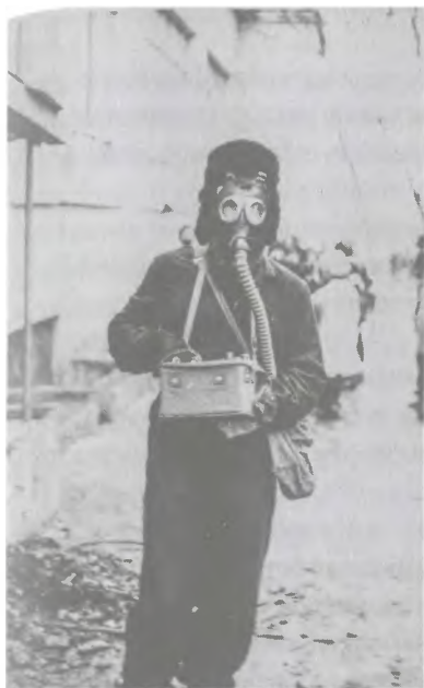
Ил. 10. Школьник в противогазе на уроке начальной военной подготовки

На уроках гражданской обороны не предлагали сушить сухари и хранить их в наволочке, зато показывали учебные диафильмы с изображением ядерного «гриба» (в начале 1980-х их показывали даже дошкольникам), учили надевать противогазы, шить ватно-марлевые повязки, пропитывать одежду специальным раствором и объясняли, что брать с собой в бомбоубежище: