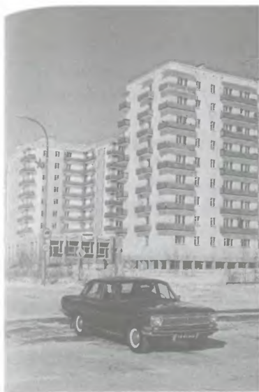
Ил. 7. Черный автомобиль ГАЗ-24 «Волга»

Правительственные машины, которые в народе прозвали «членовозами», никогда не делают незапланированных остановок. Если зазевавшийся пешеход оказывался под их колесами, то из окна машины на полном ходу выкидывался жетон «Похоронить за счет государства» 10 .