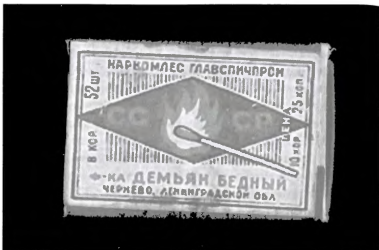
Ил. 3. На этикетке спичечного коробка в перевернутом виде можно углядеть профиль Троцкого с бородкой