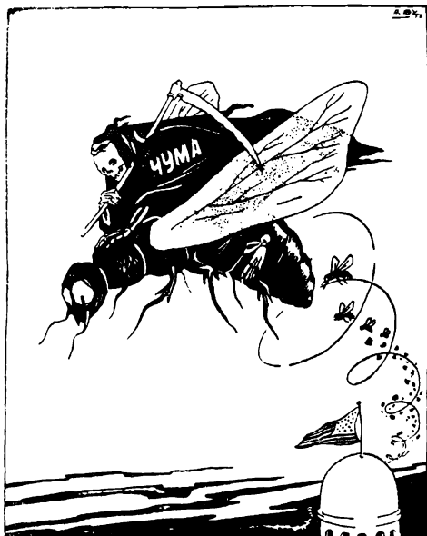
Ил. 6. Иллюстрация к газетной статье о бактериологическом оружии, которое США якобы применяют в Корее

СССР колорадского жука, но и о новой опасности такого же типа: о бомбах, из которых при падении вылетают зараженные чумой мухи, или о прививках тифа, которые местному населению делают под видом медицинской помощи. Газета «Смена» весной 1952 года пестрит заголовками: «Военнослужащие американской армии подтверждают применение американскими агрессорами бактериологического оружия» 58 или «Американские интервенты продолжают совершать чудовищные преступления» 59 . Партия и правительство организуют заводские митинги по поводу войны в Корее: на этих митингах рассказывают о коварстве американского командования и зачитывают резолюции против «применения американскими агрессорами биологического оружия» 60 . Корреспонденты сообщали, что американские империалисты в Корее сбрасывают бомбы с «чумными