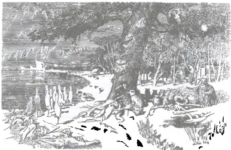
(С картины художника Крамского Н. И.)

100 ЛЕТ СО ДНЯ СМЕРТИ ВЕЛИКОГО ПОЭТА А. С. ПУШКИНА 10 февраля (29 января) 1837 г. — 10 февраля 1937 г.